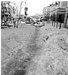
Апрель 2018 г. Козьи тропы в центре города.

И никому эти безобразия во властных кабинетах не интересны. Понятно, что «снег - это вода. Вода должна уйти» сама. Только для ухода есть еще одна неозвученная фаза воды - ЛЕД. А он так просто не растает. В городе существуют несколько структур, обязанных вести мониторинг благоустройства городской среды. Взять, к примеру, административно-техническую инспекцию. Но у нас, как в той поговорке о сапожнике без сапог, это уважаемое учреждение у собственного порога не видит ни снега, ни льда.