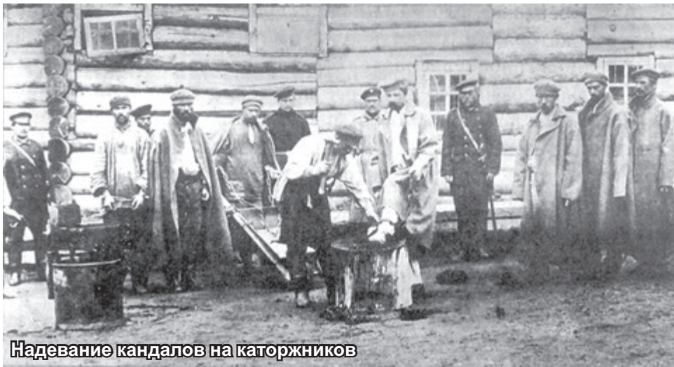
Надевание кандалов на каторжников

В современной России с ельцинских времен установлен день памяти «жертв политических репрессий». Его ежегодно отмечают 30 октября. Предлагаю начать кампанию по «ребрендингу» этого «праздника» наших либералов, запад-