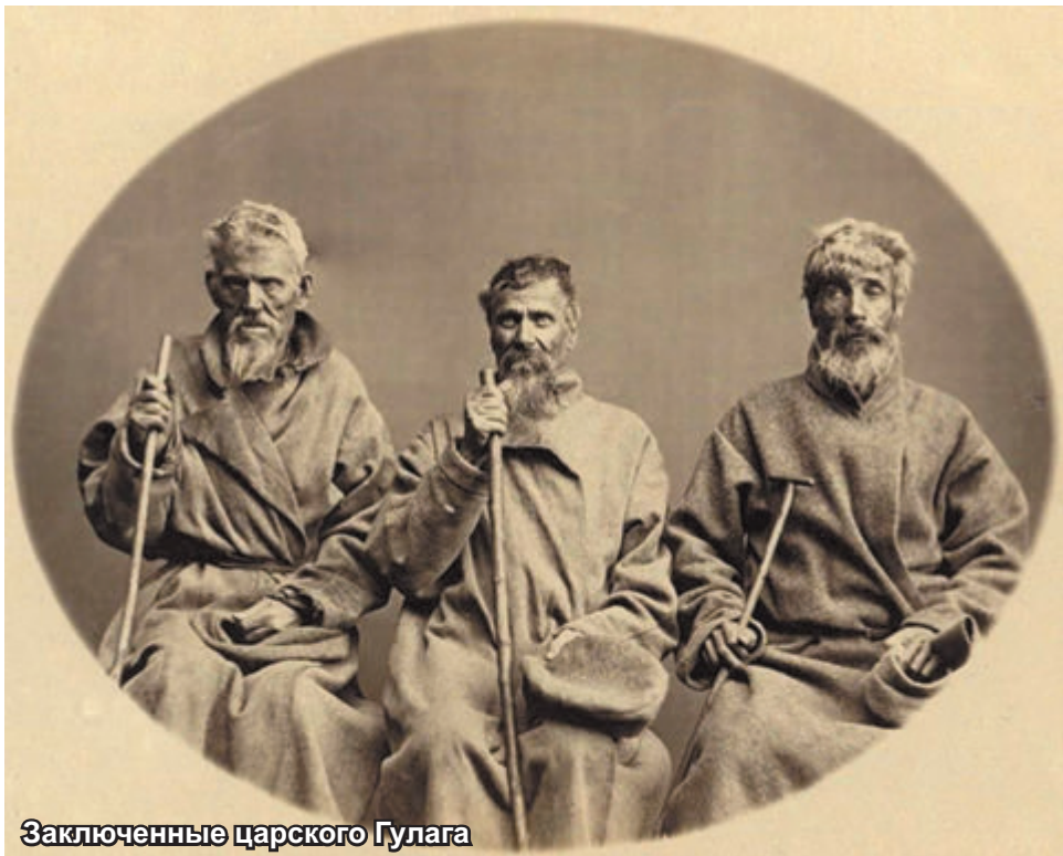
Заключенные царского Гулага

Конечно, среди такого количества преступников попадались и незаслуженно, по ошибке осужденные люди. Но грести всех под одну гребенку и объявлять извергов и злодеев поголовно «невинными жертвами» Сталина могут только отъявленные лжецы. Недаром члены секты «Свидетели Солженицына» молятся на своего кумира с такой «говорящей» фамилией.