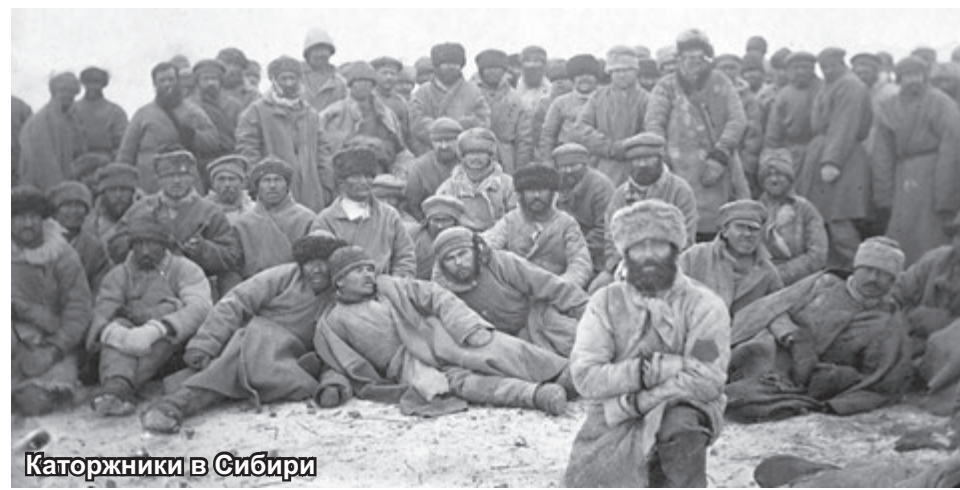
Каторжники в Сибири

Нынешние монархисты проливают горючие слезы на своем шествии по пути «Царской голгофы» до местечка Ганина Яма, где летом