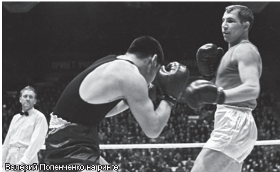
Валерий Попенченко на ринге

Первая яркая спортивная победа была в 1955 году – первенство СССР среди юношей. В 1959 году Попенченко стал чемпионом СССР по боксу, спустя год – бронзовым призером, а с 1961 по 1965 года выиграл все чемпионаты Советского Союза, в этот же период завоевал не одну победу на чемпионатах Европы. На XVIII Олимпийских играх в Токио в 1964 году стал обладателем золотой медали. Валерий Попенченко – единственный из советских боксеров за историю выступлений на Олимпиадах награжден Кубком Вала Баркера, который присуждается самым техничным спортсменам. Из 213 боев Попенченко выиграл 200, сотню – нока-