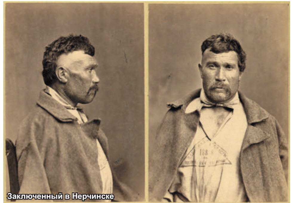
Заключенный в Нерчинске

Марины Мнишек – Иван Ворёнок. Вместе с ним был казнен фаворит Марины Мнишек казачий атаман Иван Заруцкий, по некоторым данным, именно Заруцкий был настоящим отцом Ворёнка. Заруцкого в духе своего времени посадили на кол. А Марина Мнишек умерла в темнице. Как свидетельствуют современники и очевидцы казни трехлетнего ребенка, петля затянулась недостаточно на детской шейке. И поэтому мальчик погиб не от удушья, а от холода, провисев несколько часов на виселице. Таким образом началось правление династии Романовых в Ипатьевском монастыре, а закончилось спустя триста лет в подвале Ипатьевского