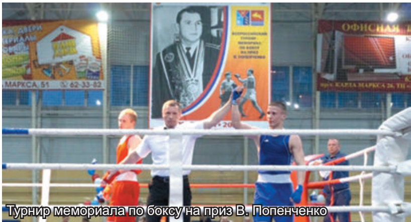
Турнир мемориала по боксу на приз В. Попенченко