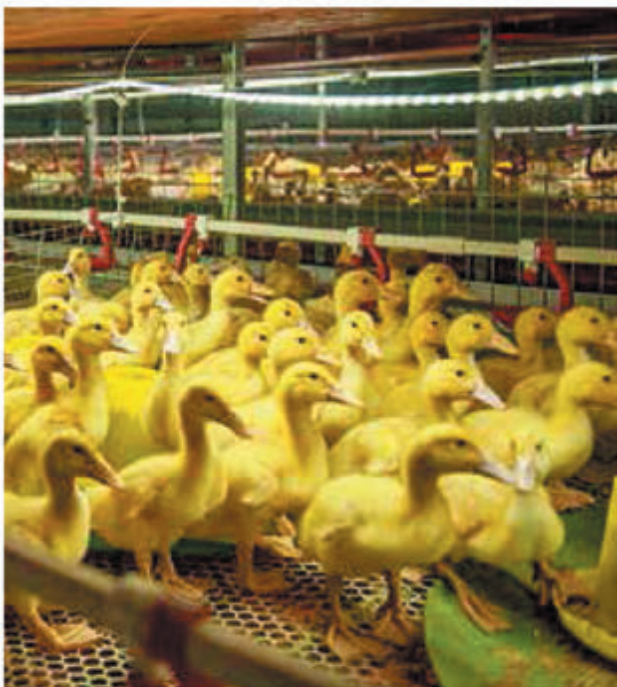
В 2018 году в деревне Личан начали вести утиное хозяйство, и это позволило создать рабочие места для 30 малоимущих семей