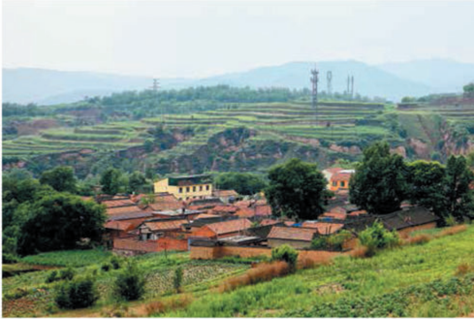
Красивая деревня Личан находится в подчинении уезда Цзоцюань в провинции Шаньси

твенным источником коллективного дохода у местных жителей были компенсации за восстановление лесов и лугов на территориях, которые раньше были пахотными