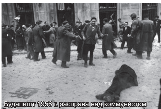
Будапешт 1956 г. расправа над коммунистом

Общинный образ жизни, артельный труд, собор-