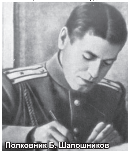
Полковник Б. Шапошников