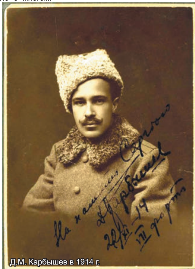
Д.М. Карбышев в 1914 г.

Невероятно высокий авторитет Д. Карбышева, как военного специалиста не только в СССР, но и в мире снискал ему не только уважение, немцы еще до начала войны внесли его в список тех, кого хотели бы использовать на службе рейху. Нацисты ошибочно считали, что Карбышев легко перейдет на их сторону. Ну как же, дворянин, подполковник Русской императорской армии, который вступил в партию только в 1940 г., по всей вероятности, только из карьерных соображений или по принуждению, думали немцы. Но очень скоро они убедились в том, что ошибались на счет Карбышева. 60-летний генерал отказался служить Гитлеру и на всех допросах выражал уверенность в конечной победе СССР. Карбышева переводили из одного концлагеря в другой. С ним работали не только асы разведки, но и психологи. В том числе и бывшие сослуживцы Карбышева по царской армии. После очередного отказа генерала сотрудничать с врагом, его перевели в одиночную камеру в берлинской тюрьме, где его навещал известный