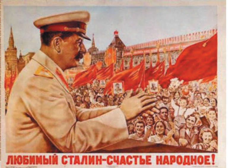
ЛЮБИМЫЙ СТАЛИН-СЧАСТЬЕ НАРОДНОЕ!

Солженицына». За минувшие три десятка лет уже давным-давно раскрыты все доступные архивы, включая те, что содержат государственную или военную тайны. Все подсчеты сделаны честными, не ангажированными властью историками и архивистами. Количество осужденных за время после окончания гражданской войны в 1922 г. и до смерти Сталина в 1953 г. известны. То есть, берется долгий и сложный период отечественной истории, в котором И. Сталин получил реальные полномочия главы, как партии, так и государства только к 1939-му г. А до этого времени он был лишь одним из партийных руководителей. И, следовательно, за перегибы, ошибки, нарушения законности он не может нести никакой ответственности. Наоборот, вина за осуждение невинных людей лежит целиком на «региональных баронах», республиканских руководителях, типа Хрущева и других явных или тайных троцкистах. Да и количество осужденных, даже реальных преступников в эти годы никак не укладывается в завывающие мантры антисталинистов. Это не «десятики и сотни миллионов», а гораздо меньше одного миллиона. За все время от Ленина до Сталина. Впрочем, тема эта многосторонняя и разбираться в черных мифах и потоках лжи от солженицынствующих можно долго и нудно, поступательно разбивая постулаты людей, враждебно настроенных к России и нашему многонациональному народу, что мы и будем делать впредь.