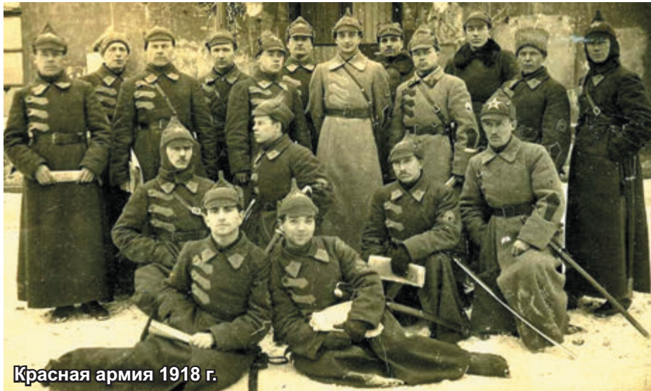
Красная армия 1918 г.