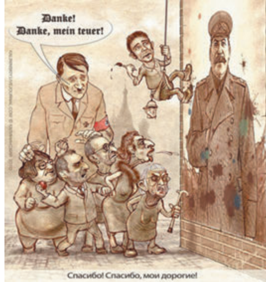
Спасибо! Спасибо, мой дорогой!

Отвечая на все «обвинения» либералов, которые можно было бы и не замечать, если бы не их оголтелая антисоветская пропаганда, несущая в своем ядре главную цель – русофобию и уничтожение исторической России со всеми народами ее населяющими, то стоит уделить некоторое внимание той лжи, что распространяют члены секты «Свидетели