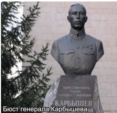
Бюст генерала Карбышева