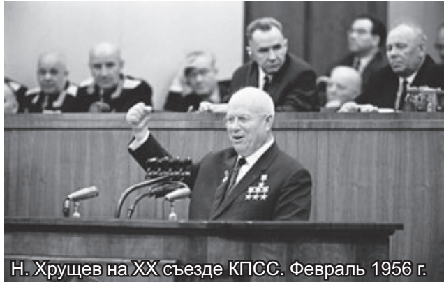
Н. Хрущев на XX съезде КПСС. Февраль 1956 г.

Наша Родина сегодня встала перед историческим выбором. 30 лет назад в СССР произошла буржуазная контрреволюция, осуществленная руками партийных ренегатов, переродившихся чиновников высокого ранга, которым очень хотелось перевести свои привилегии, связанные с работой и чинами, в наследственные, по сути нефеодалные, передающиеся детям, капиталы и имущество. А началось это «гниение рыбы с головы» после 1956 г. вместе с «секретным докладом» Н. Хрущева на XX съезде партии, в котором преемник И. Сталина «развенчал культ личности» своего предшественника. Интересно, что