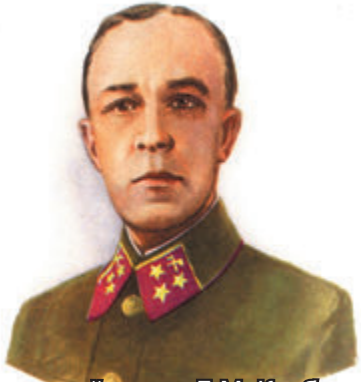
Генерал-лейтенант Д.М. Карбышев