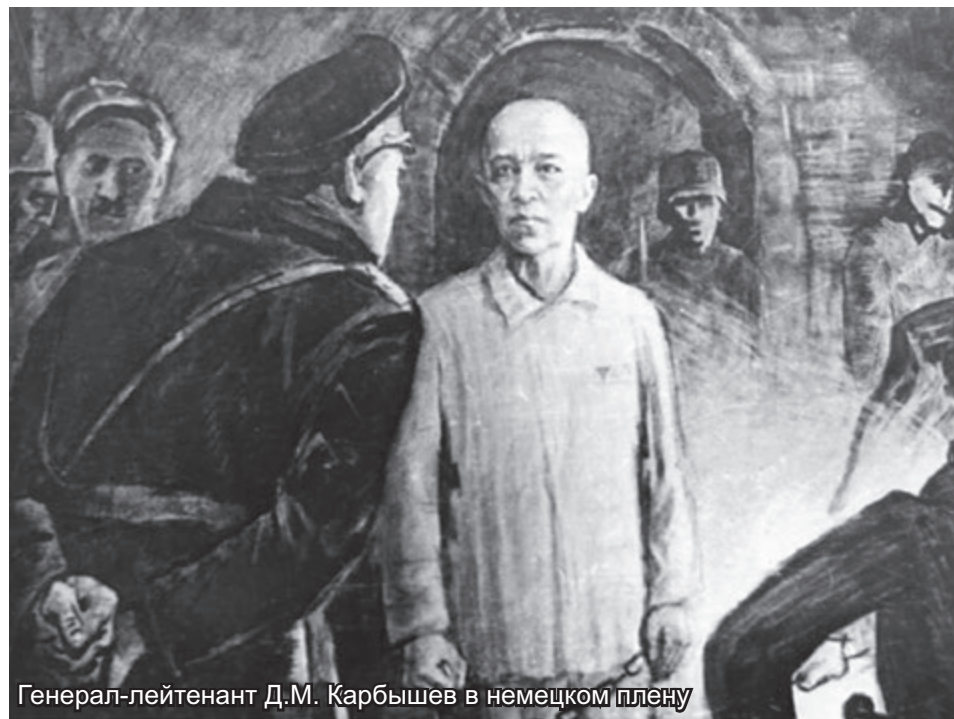
Генерал-лейтенант Д.М. Карбышев в немецком плену