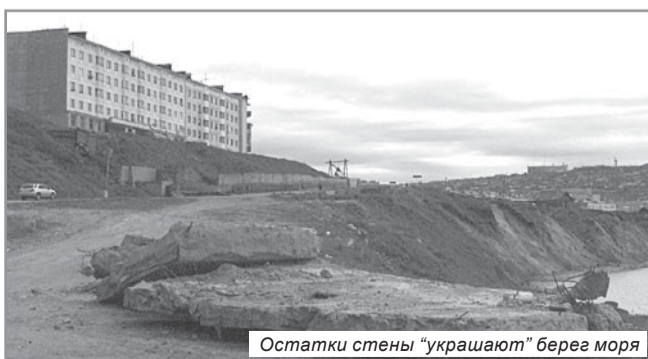
Остатки стены "украшают" берег моря

отсутствии нормальных водоотводящих систем все это вызывает серьезную угрозу всем объектам и жизни людей.