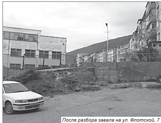
После разбора завала на ул. Флотской, 7