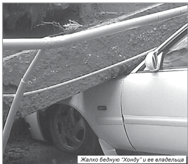
Жалко бедную "Хонду" и ее владельца

15 июня сего года рухнула подпорная стена на улице Флотской, 7, и придавила своими плитами три личных автомобиля жителей Моргородка. Только по чистой случайности происшествие обошлось без человеческих жертв. Но кто теперь возместит потерпевшим материальный и моральный ущерб? Что чувствовали люди, увидевшие свои машины, погребенные под плитами, как выдержали их сердца эту страшную картину? Кто ответит за этот бардак – департамент ЖКХ, РЭУ-4, департамент САТЭК, мэрия или