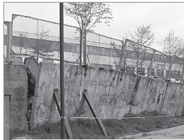
Подпорная стена детского садика № 60, на ул. Портовой, 38

к устранению недостатков. Вода разрушила дорожное покрытие, подпорные стены, на очереди жилые дома.