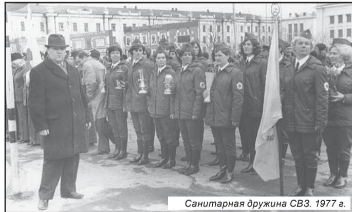
Санитарная дружина СВЗ. 1977 г.