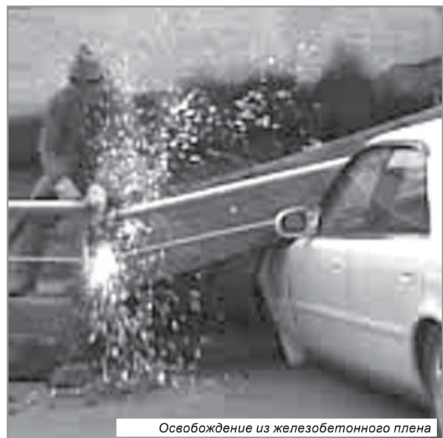
Освобождение из железобетонного плена

К сожалению, никто не делает никаких выводов. Летом прошлого года рухнула подпорная стена у дороги в Морской порт, возле дома на Портовой, 38, едва не похоронив под собой проезжающие машины. Многотонные железобетонные глыбы оборвали силовые электрокабели, подающие электропитание к объектам Морского торгового порта. Для устранения аварии потребовалось значительное время. Затрачены и потеряны десятки тысяч рублей. Выводы руководителями ответственных служб не сделаны. Оставшаяся часть этой многометровой подпорной стены находится не в лучшем состоянии. Остатки упавшей стены даже увозить не стали,