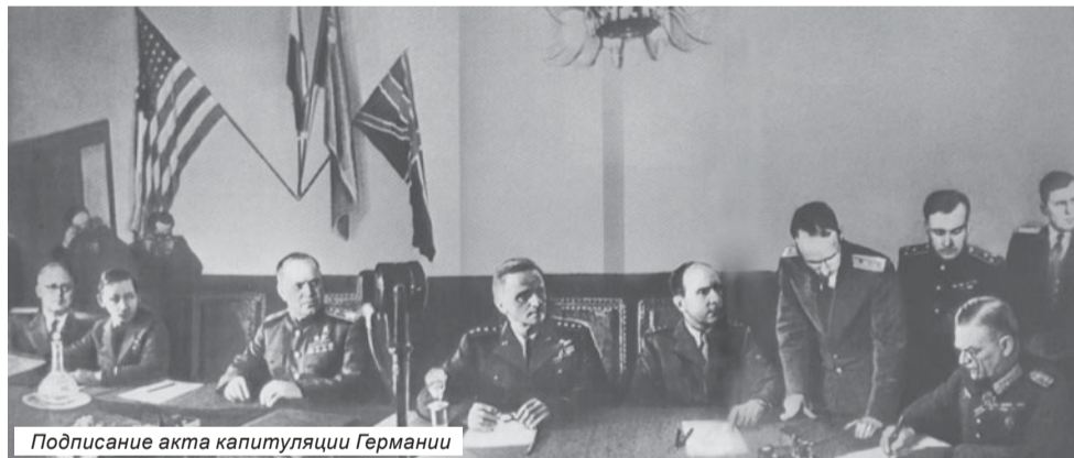
Подписание акта капитуляции Германии

Высказывания А. Даллеса и сегодня являются программным документом США. Так, президент США Билл Клинтон 25 октября 1995 года на закрытом совещании объединенного комитета начальников штабов сказал: «Последние десять лет тактика в отношении СССР и его союзников убедительно доказала правильность взятого нами курса на устранение одной из сильнейших держав мира, а также сильнейшего военного блока. Используя