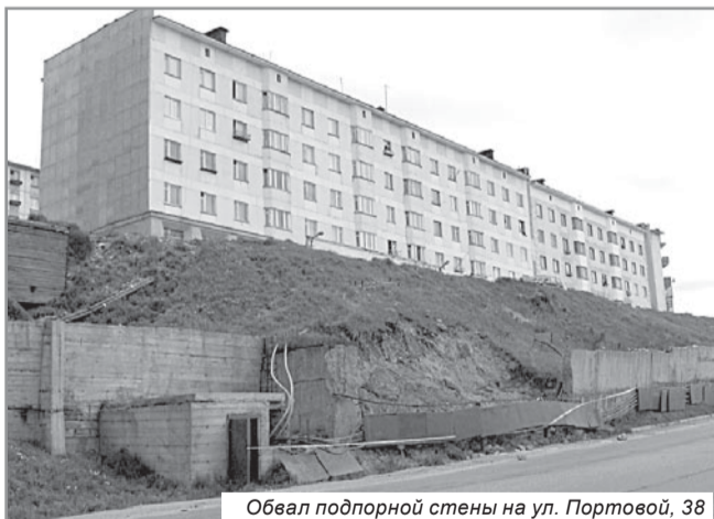
Обвал подпорной стены на ул. Портовой, 38

На очереди подпорная стена у детского сада 9 60, расположенного в Моргородке. Сейчас часть наклоненной стены удерживается стальными швеллерами. Но думаю, что это не надолго. Все эти происшествия не случайность, а закономерность. Моргородок расположен на склоне сопки, уходящей в море. Одна из причин происходящих явлений это то, что в зимний период выпавший снег не вывозится с территории жилого массива и весной в период таяния превращается в бурные водные потоки, которые разрушают склоны, дороги, подмывают фундаменты зданий. Кроме того, активно действуют грунтовые воды, которые вызывают огромные наледи в зимний период. В летний и осенний периоды свою лепту вносят дожди. При