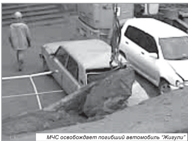
МЧС освобождает погибший автомобиль "Жигули"

а просто утащили к морю, видимо для улучшения пейзажа.