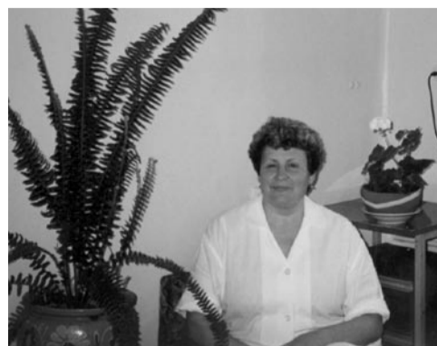
Работники хирургического отделения Магаданской областной больницы

Слава, слава докторам, Санитаркам, фельдшерам, Всем медсестрам, окулистам, Акушерам, протезистам, Стоматологам и лорам, Славу мы поем всем хором.