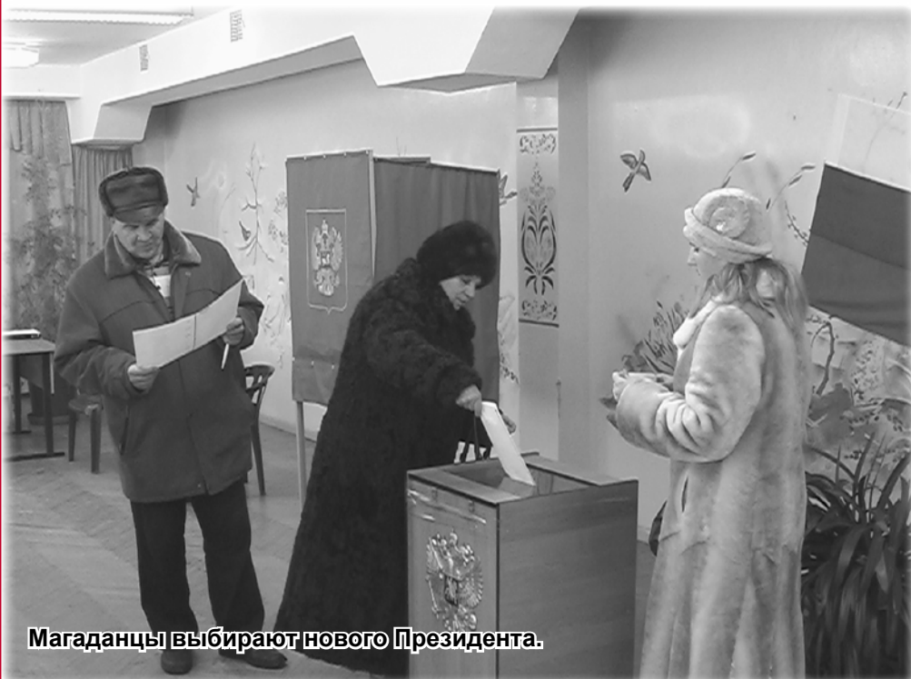
Магаданцы выбирают нового Президента.