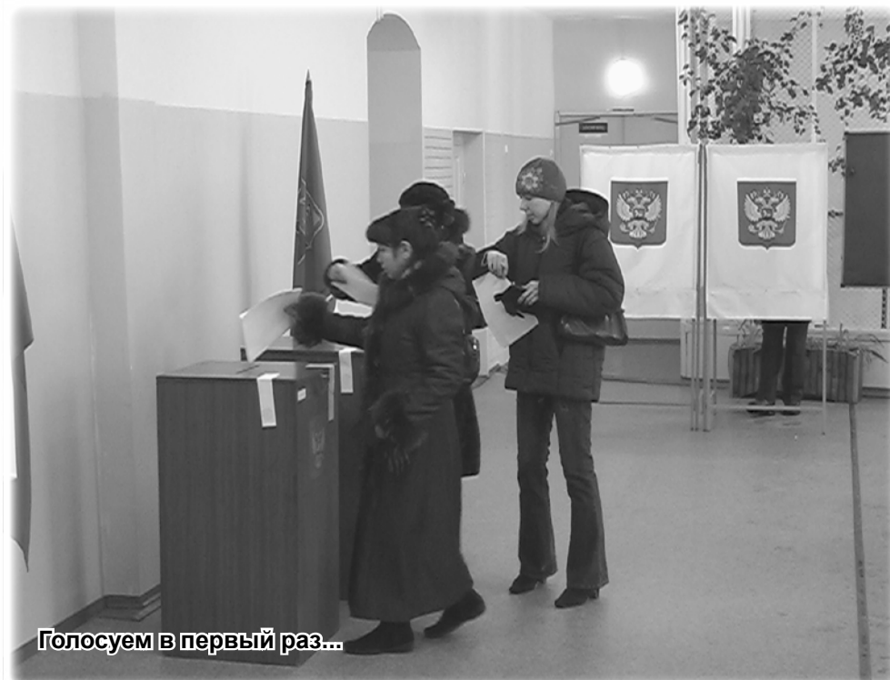
Голосуем в первый раз...