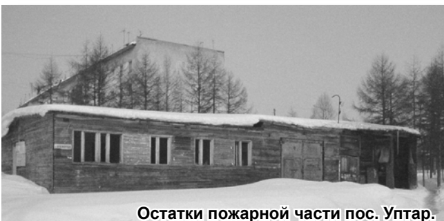
Остатки пожарной части пос. Уптар.