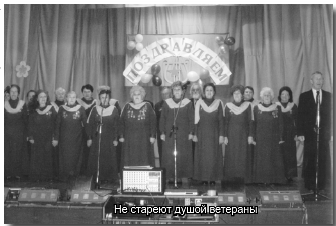
Не стареют душой ветераны

и совместных действий во благо процветания нашей Родины.