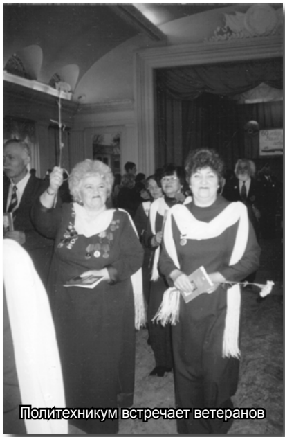
Политехникум встречает ветеранов

Идя навстречу 63-ей годовщине Великой Победы, во всех учебных заведениях города проводилась большая работа Областного Совета ветеранов по проведению встреч ветеранов