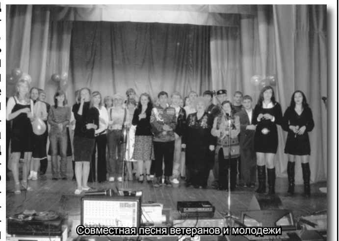
Совместная песня ветеранов и молодежи