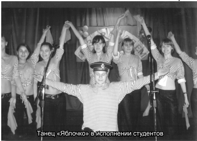
Танец «Яблочко» в исполнении студентов