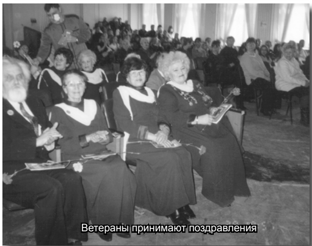
Ветераны принимают поздравления

Мы также хотим поздравить с 15-летним юбилеем участников нашего замечательного народного хора ветеранов. Пожелать ветеранам и молодежи крепкого здоровья, счастья