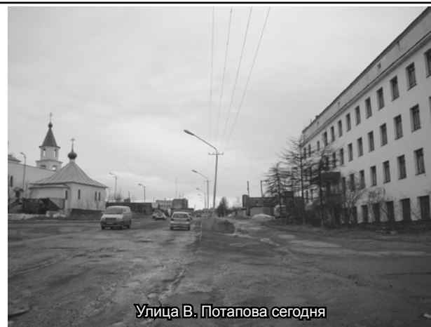
Улица В. Потапова сегодня